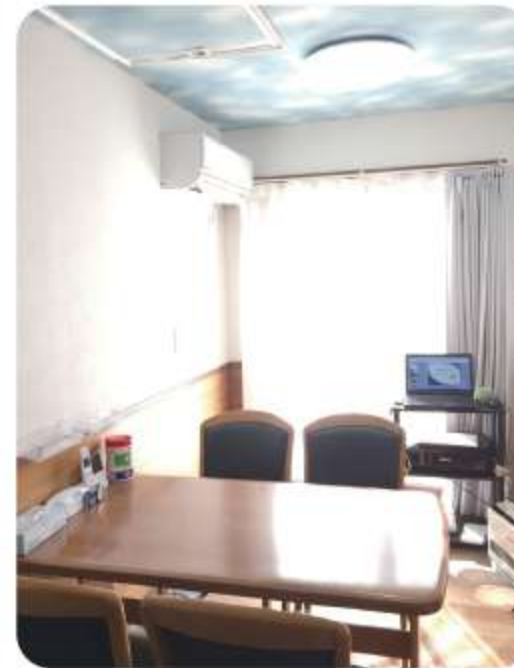
食堂(共用スペース)